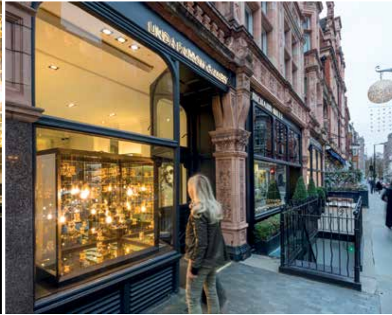
Linda Farrow Gallery, London